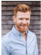
Ernst Christ Maler- und Gipserunternehmer- verband des Kantons Solothurn